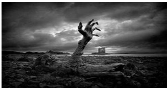
Anastasia e Beatrice II B

L'inquinamento del suolo avviene anche tramite la spazzatura, ovvero i liquami.